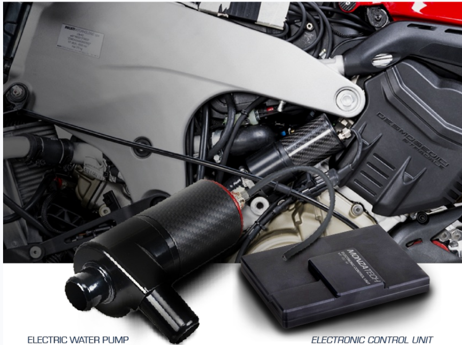
ELECTRIC WATER PUMP MWP-070